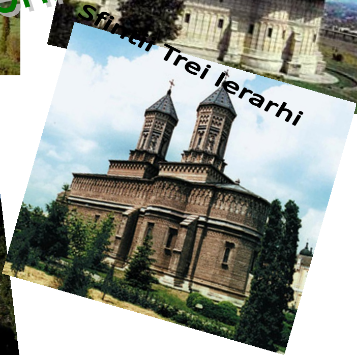
Sfintii Trei Ierarhi